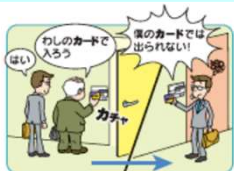
アンチバースバック