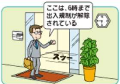
タイムスケジュール